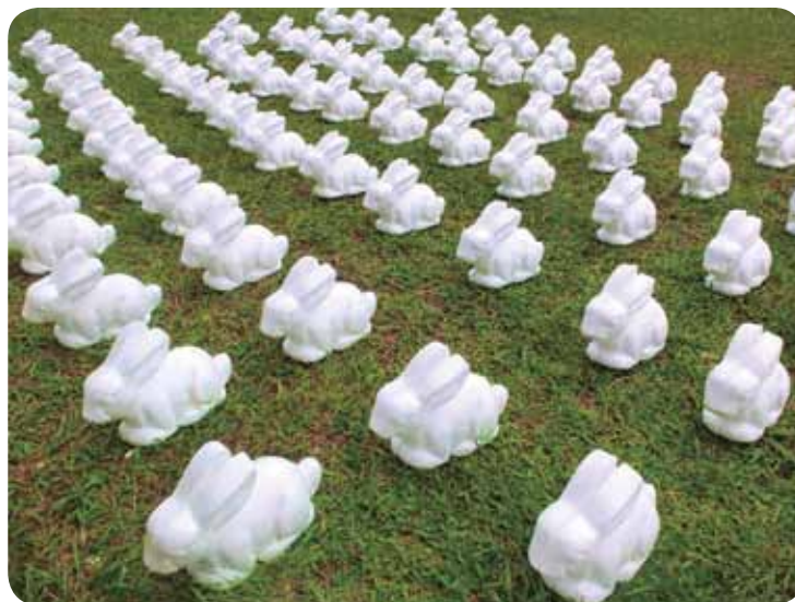
Coelhos - Foto por Yvan Rodic